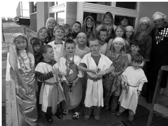
Die Hochzeitsgesellschaft macht sich bereit zum Fest