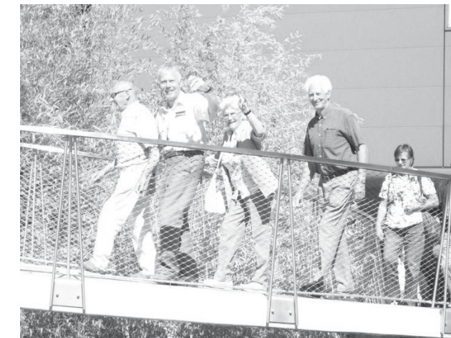
Vergnügte Gesichter am Seniorenausflug am 6. September ins Minimundus zusammen mit der Kirchgemeinde Benken